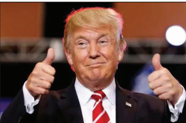
ਕਹਿਣਾ ਹੈ ਕਿ ਇਹ ਨਵਾਂ ਸਿਸਟਮ ਅਤਿਵਾਦ, ਫ਼ਰਜ਼ੀ ਦਸਤਾਵੇਜ਼, ਖ਼ਤਰਿਆਂ ਨਾਲ ਨਜਿੱਠੇਗਾ। ਇਹ ਵੀਜ਼ਾ ਤੋਂ ਵੱਧ ਸਮਾਂ ਰੁਕਣ ਅਤੇ

ਵਾਸ਼ਿੰਗਟਨ: ਰਾਸ਼ਟਰਪਤੀ ਡੋਨਲਡ ਟਰੰਪ ਦੀ ਸਖ਼ਤ ਇਮੀਗ੍ਰੇਸ਼ਨ ਪੌਲਿਸੀ ਤਹਿਤ ਅਮਰੀਕਾ 'ਚ ਹੁਣ ਹਰ ਵਿਦੇਸ਼ੀ ਦੀ ਐਂਟਰੀ ਅਤੇ ਐਗਜ਼ਿਟ ਵੇਲੇ ਫ਼ੋਟੋ ਲਈ ਜਾਵੇਗੀ। ਇਹ ਕੰਮ ਨਵੀਂ ਫ਼ੋਸ ਰੈਕੋਰਡੀਸ਼ਨ ਤਕਨੀਕ ਨਾਲ ਹੋਵੇਗਾ। ਇਸ ਦਾ ਮਕਸਦ ਫ਼ਰਜ਼ੀ ਦਸਤਾਵੇਜ਼ਾਂ ਨੂੰ ਰੋਕਣਾ ਅਤੇ ਦੇਸ਼ ਨੂੰ ਸੁਰੱਖਿਅਤ ਰੱਖਣਾ ਹੈ। ਅਮਰੀਕੀ ਬਾਰਡਰ ਸੈਕਿਊਰਿਟੀ ਡਿਪਾਰਟਮੈਂਟ (CBP) ਨੇ ਦੱਸਿਆ ਕਿ ਹਵਾਈ ਐਂਡਿਆਂ, ਸਮੁੰਦਰੀ ਬੰਦਰਗਾਹਾਂ ਤੇ ਜ਼ਮੀਨੀ ਹੱਦਾਂ 'ਤੇ ਫ਼ੋਟੋਆਂ ਅਤੇ ਜਾਣਕਾਰੀ ਇਕੱਠੀ ਕੀਤੀ ਜਾਵੇਗੀ। CBP ਦਾ