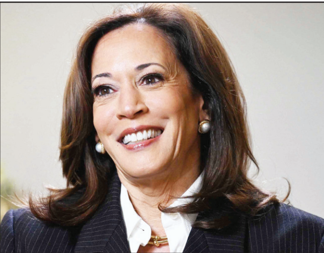
ਵਜੋਂ ਹੈਰਿਸ ਦੇ ਤਜਰਬੇ 'ਤੇ ਕੇਂਦ੍ਰਿਤ ਹੈ ਕਿਉਂਕਿ ਉਸ ਸਮੇਂ ਦੇ

ਵਾਸ਼ਿੰਗਟਨ: ਕਮਲਾ ਹੈਰਿਸ ਨੇ ਅਮਰੀਕੀ ਰਾਸ਼ਟਰਪਤੀ ਅਹੁਦੇ ਦੀ ਦੌੜ 'ਚ ਦੁਬਾਰਾ ਸ਼ਾਮਲ ਹੋਣ ਦੀ ਸੰਭਾਵਨਾ ਤੋਂ ਇਨਕਾਰ ਨਹੀਂ ਕੀਤਾ। ਇੱਕ ਨਿਊਜ਼ ਚੈਨਲ ਨਾਲ ਇੱਕ ਇੰਟਰਵਿਊ 'ਚ ਹੈਰਿਸ ਨੇ ਕਿਹਾ ਕਿ ਉਸ ਨੂੰ ਉਮੀਦ ਹੈ ਕਿ ਆਉਣ ਵਾਲੇ ਸਾਲਾਂ 'ਚ ਇੱਕ ਔਰਤ ਰਾਸ਼ਟਰਪਤੀ ਬਣੇਗੀ ਅਤੇ ਸੰਭਵ ਤੌਰ 'ਤੇ ਉਹ ਹੋ ਸਕਦੀ ਹੈ। ਉਨ੍ਹਾਂ ਕਿਹਾ, “ਮੈਂ ਹੁਣ ਤਕ ਹਾਰ ਨਹੀਂ ਮੰਨੀ।” ਸਾਬਕਾ ਉਪ ਰਾਸ਼ਟਰਪਤੀ ਨੇ ਕਿਹਾ ਕਿ ਉਸ ਨੇ ਅਜੇ ਤਕ 2028 'ਚ ਰਾਸ਼ਟਰਪਤੀ ਅਹੁਦੇ ਲਈ ਚੋਣ ਲੜਨ ਬਾਰੇ ਕੋਈ ਫ਼ੈਸਲਾ ਨਹੀਂ